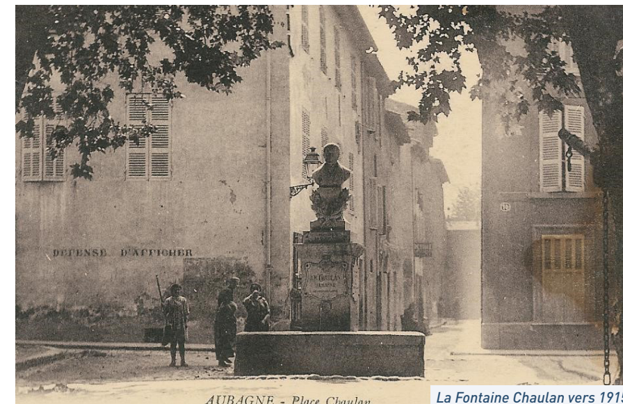
AUBAGNE - Place Chaulan