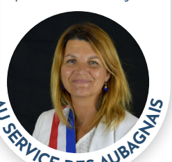
AU SERVICE DES AUBAGNAIS