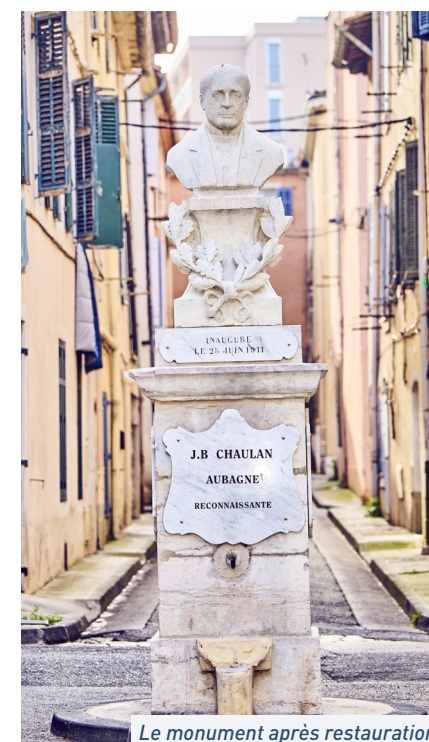
Le monument après restauration.

Pour en savoir plus, vous pouvez consulter le livret de l'exposition Vivo li nòvi!: https://www.aubagne.fr/vivre-a-aubagne/vie-culturelle/les-expositions-a-lhotel-de-ville/