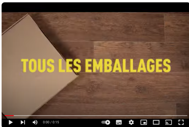
Extension des consignes de tri - été 2023

La vidéo la plus vue de l'année : www.youtube.com/watch?v=j4K01m4ulal