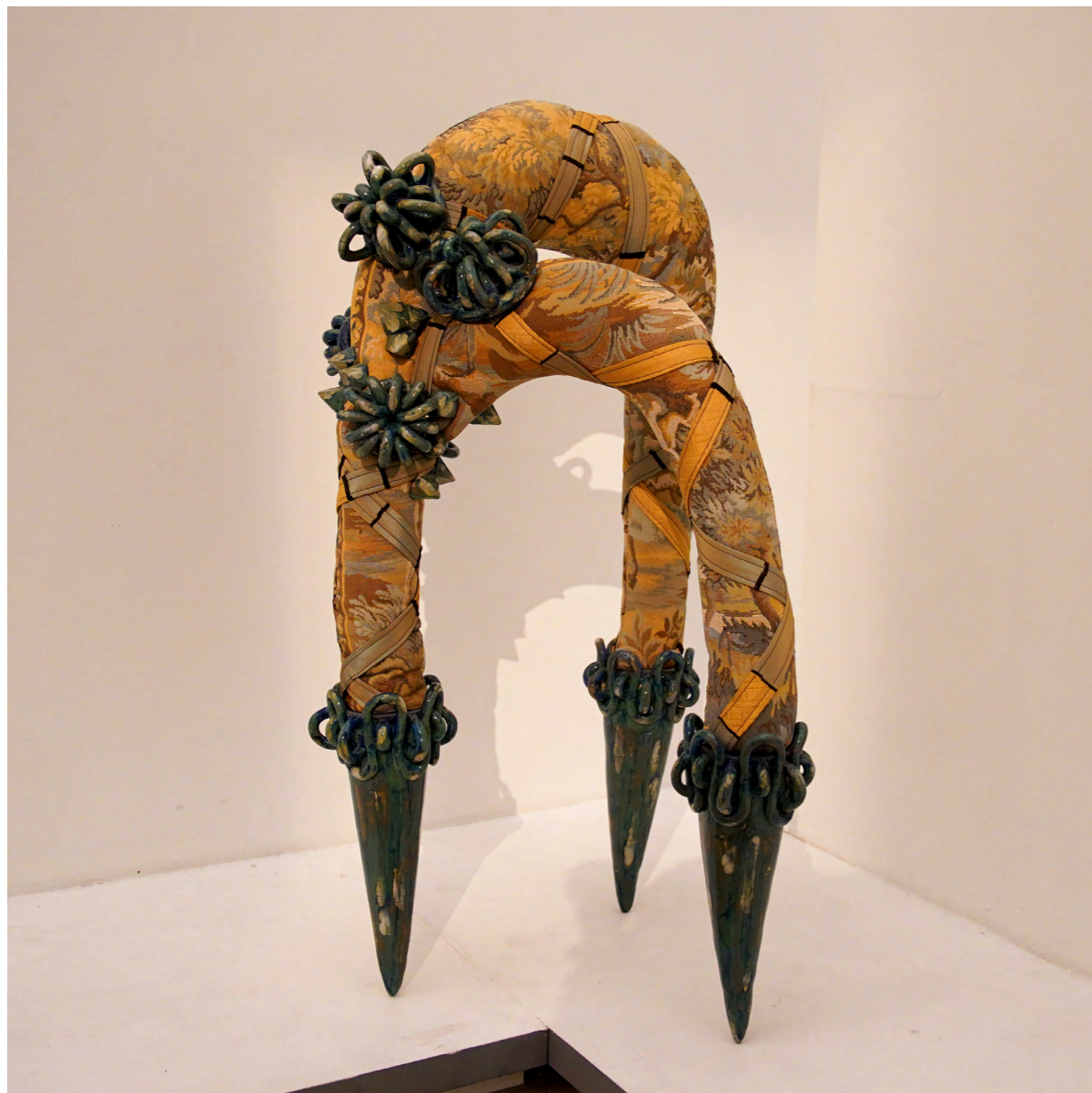
Les ferrêts d'iris 2021 grés émailé, tapisserie cousue, rembourrage, tissu 60x60x116 cm