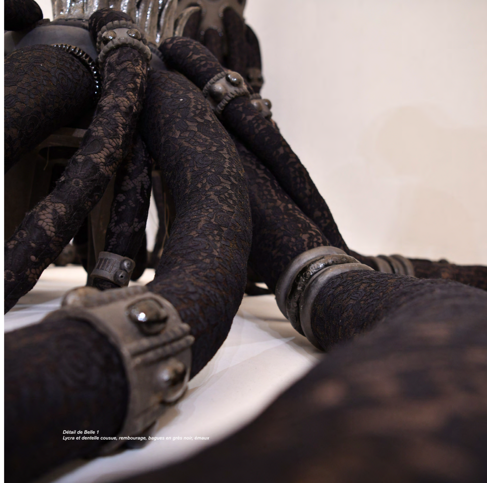
Détail de Belle 1 Lykra et dentelle cousue, rembourage, bagues en grés noir, émaux