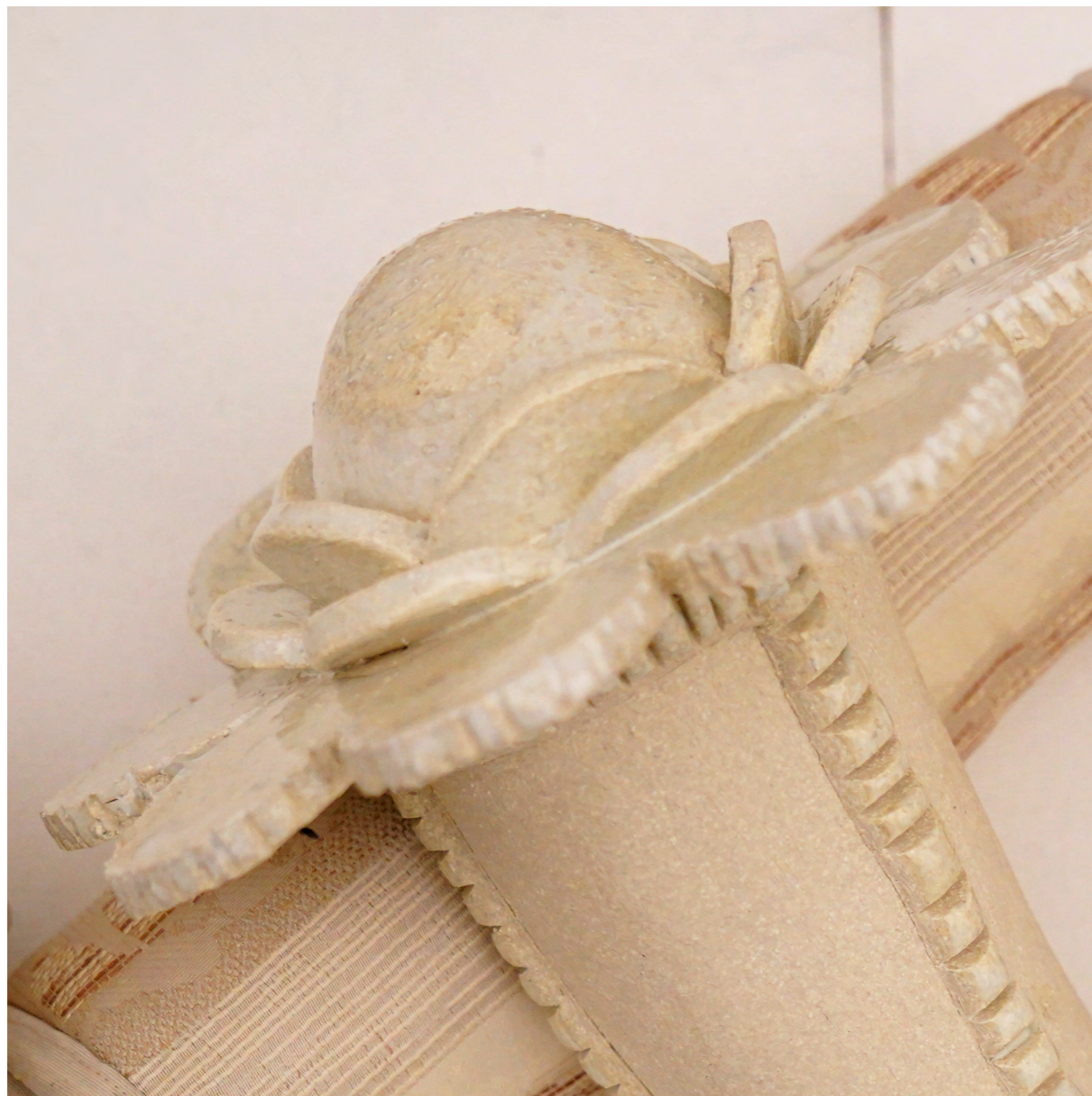
Détail des Endormies 2024 grés porcelainique, émaux, mini pochons en textile