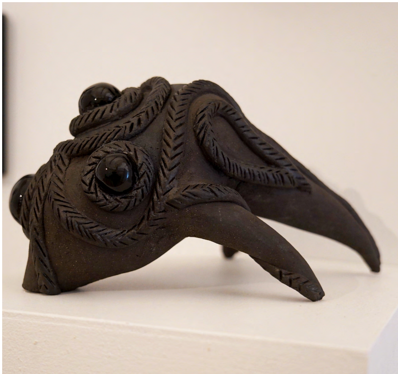
Noir 2022, grés noir, émaux 30X20X18 cm