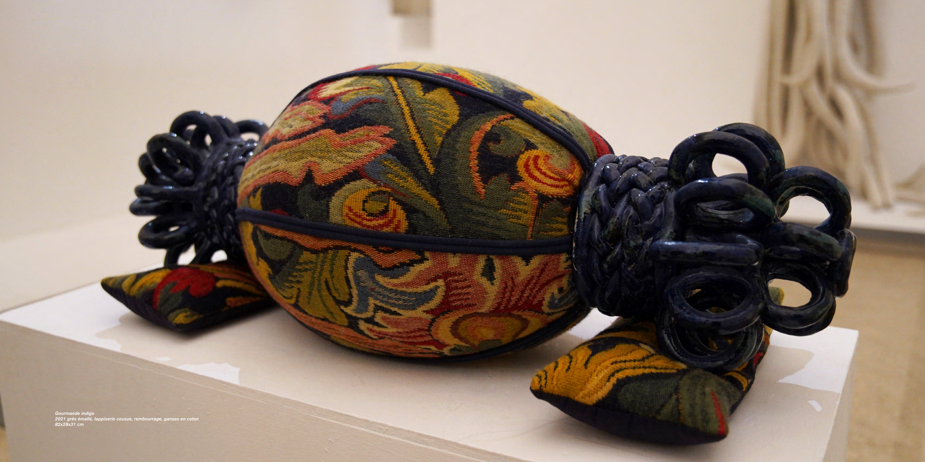
Gourmande indigo 2021 grés émailé, tapisserie cousue, rembourrage, ganses en coton 82x28x31 cm