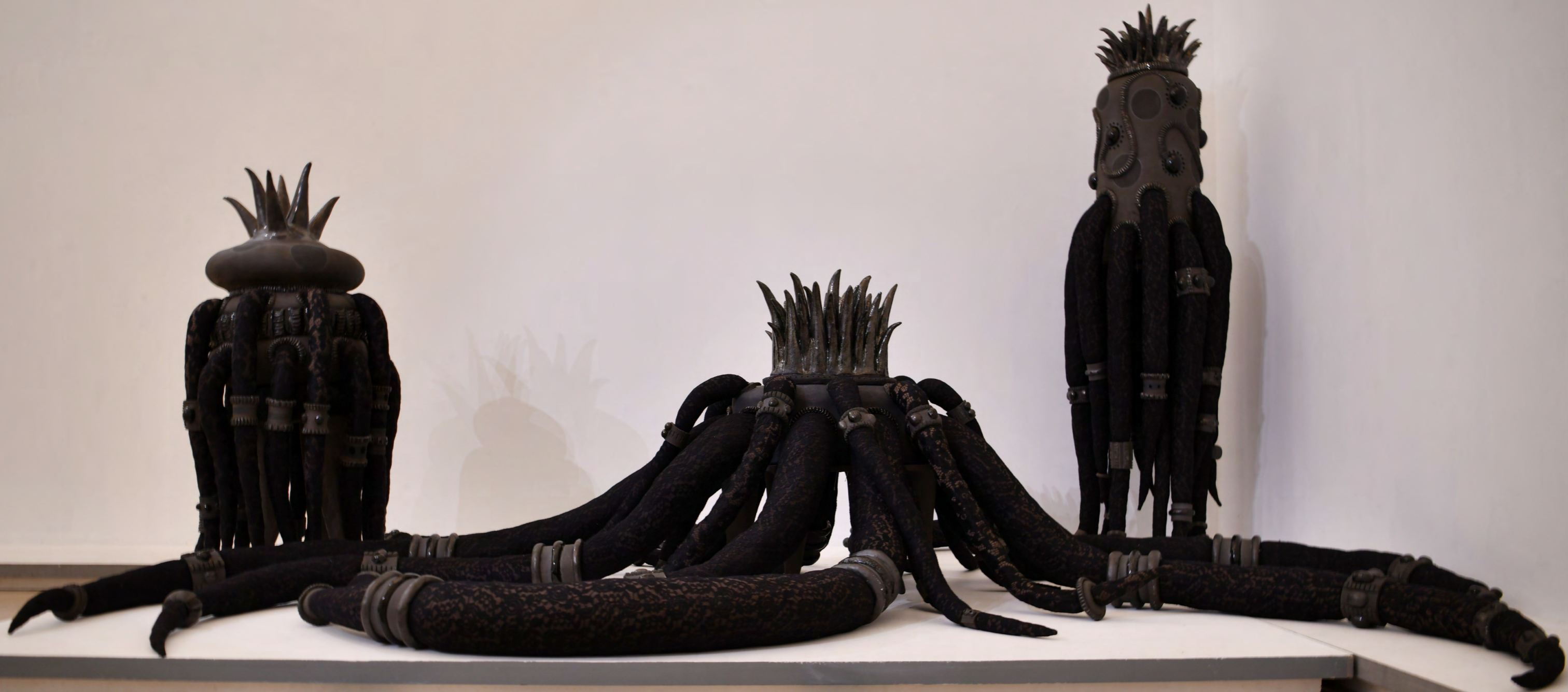
Trois Belles grés noir, émaux, tissu, dentelle, rembourrage Belle 1 2017 400x350x85 cm Belle 2 2018 70x70x130 cm Belle3 2018 60x70x210 cm