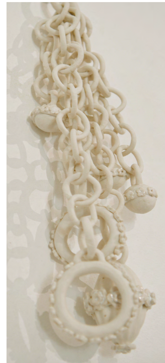
Menottes et grelots 2024 porcelaine, Émaux 43x12x5 cm