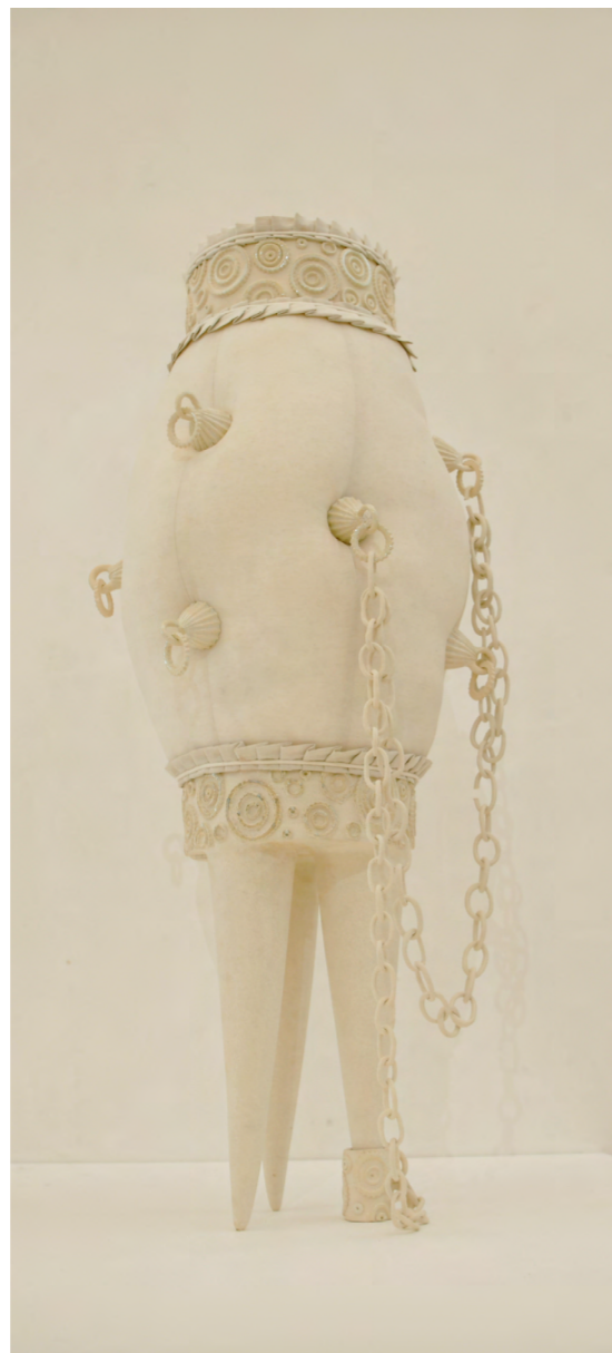
Lundi 11 avril 2016 grés, porcelaine, Émaux, textile cousue