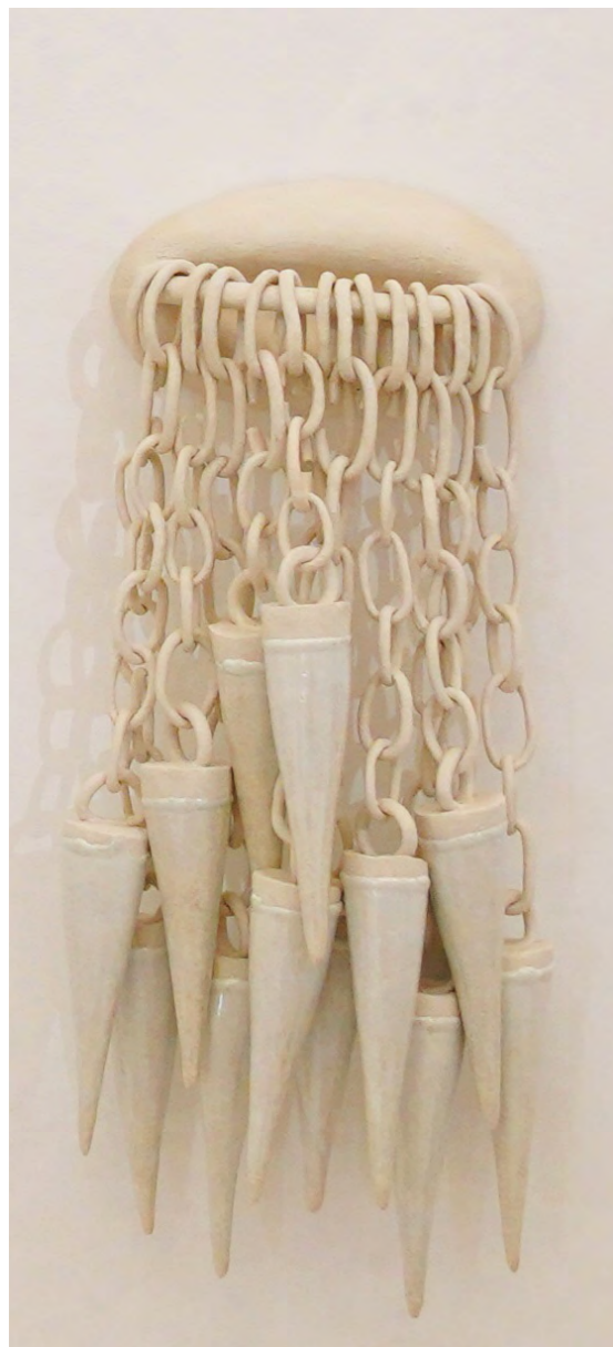
14 talons aiguilles 2015 grés, porcelaine, Émaux