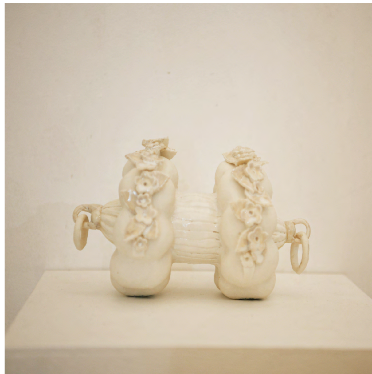
Fleurs et anneaux 2016 porcelaine, Émaux 21x14x12 cm