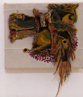
Série petite chute 2021 Tapisserie, velours, ganse ceillets métallique, broderie, coton piqué sur toile de lin tendue sur châssis, grès émaillé 20x20x7 cm