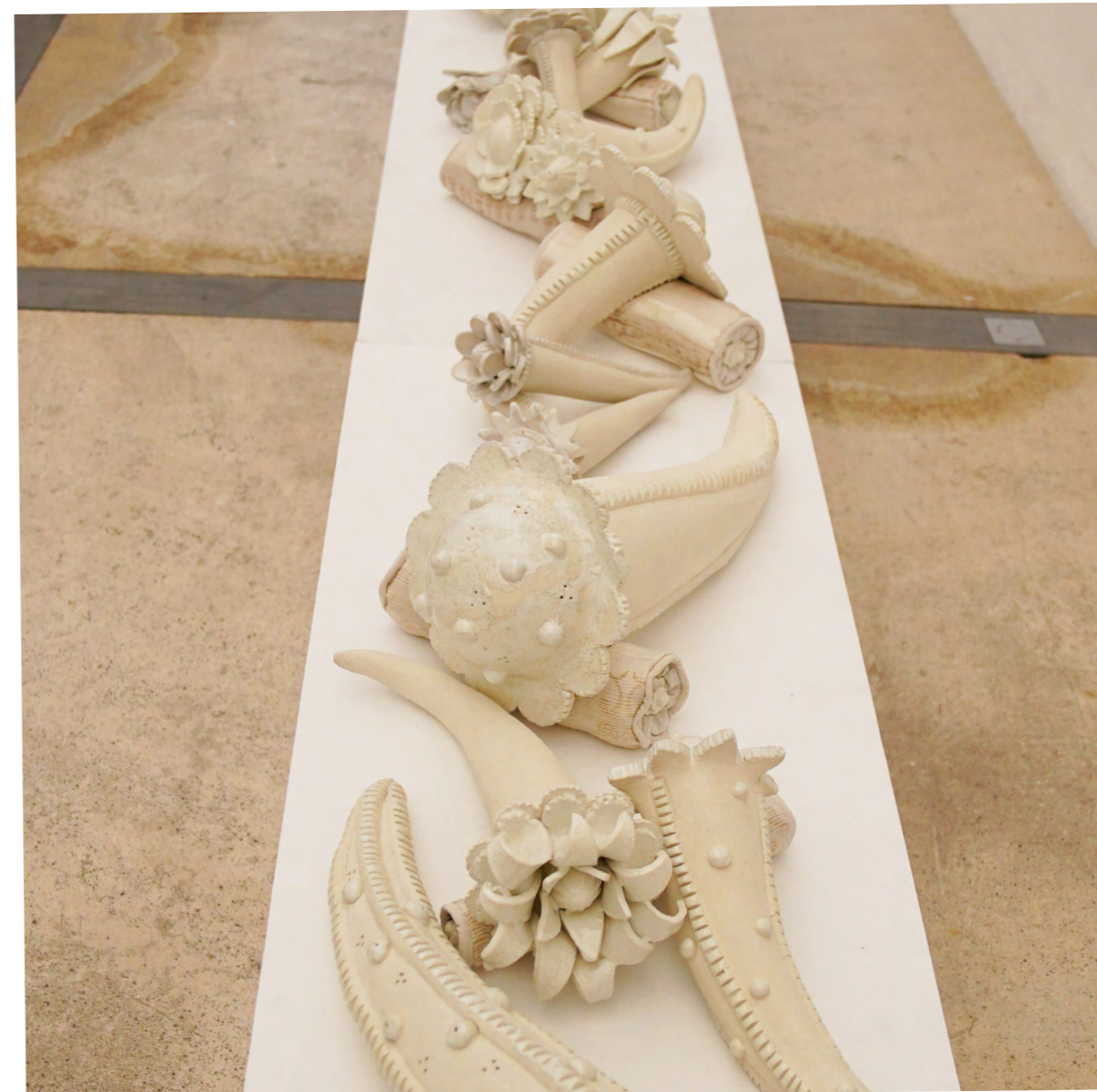
Les endormies 2024 21 pièces Grés porcelainique, émaux, mini pochons en textile 450x50 cm