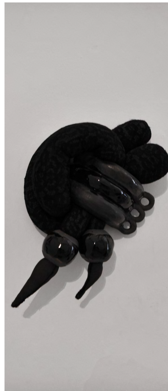
2 bijoux, 3 anneaux 2020 grès noir, émaille, lycra, dentelles, rembourrage 38x23x20 cm