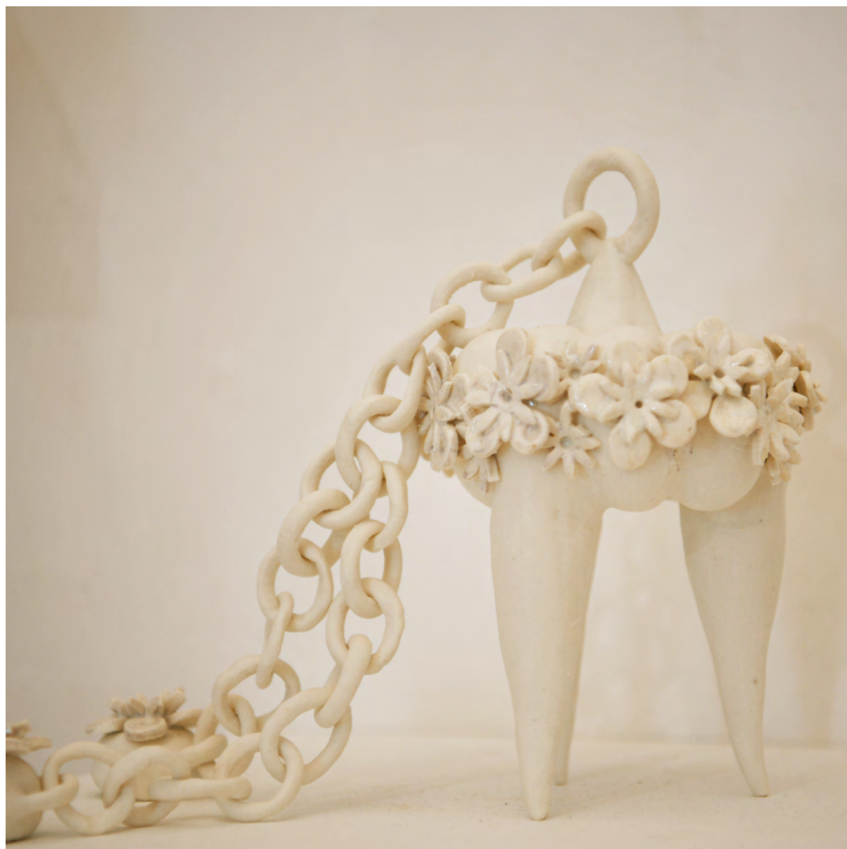
Sculpture aux patins 2016 porcelaine, Émaux