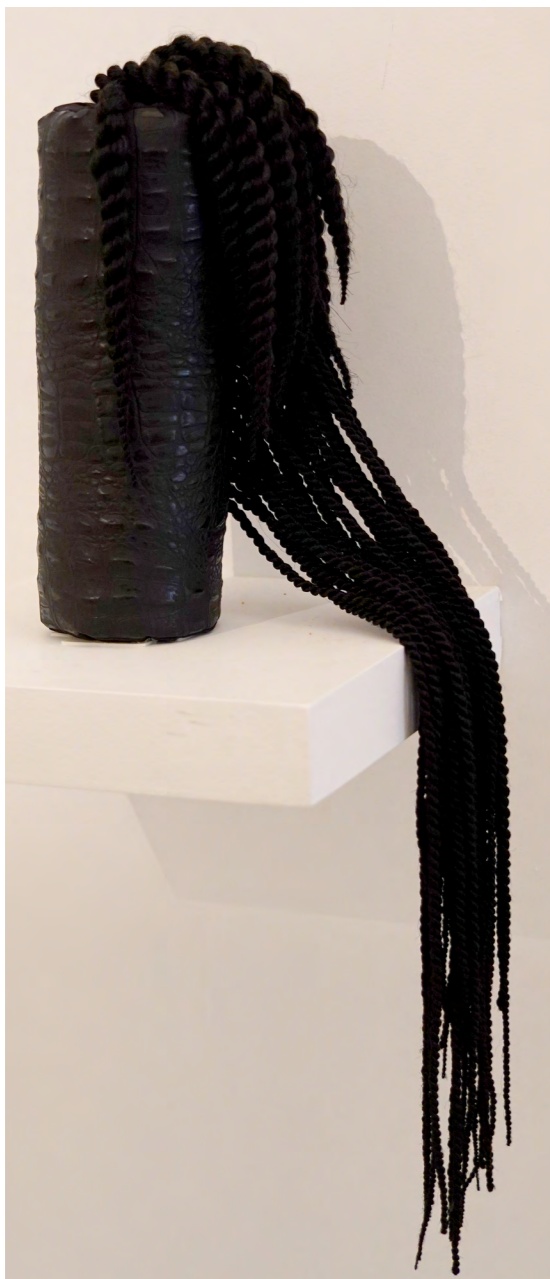
Sensuelle du mercredi 5décembre 2018 Cuir synthétique cousu, rembourré, cheveux synthétiques