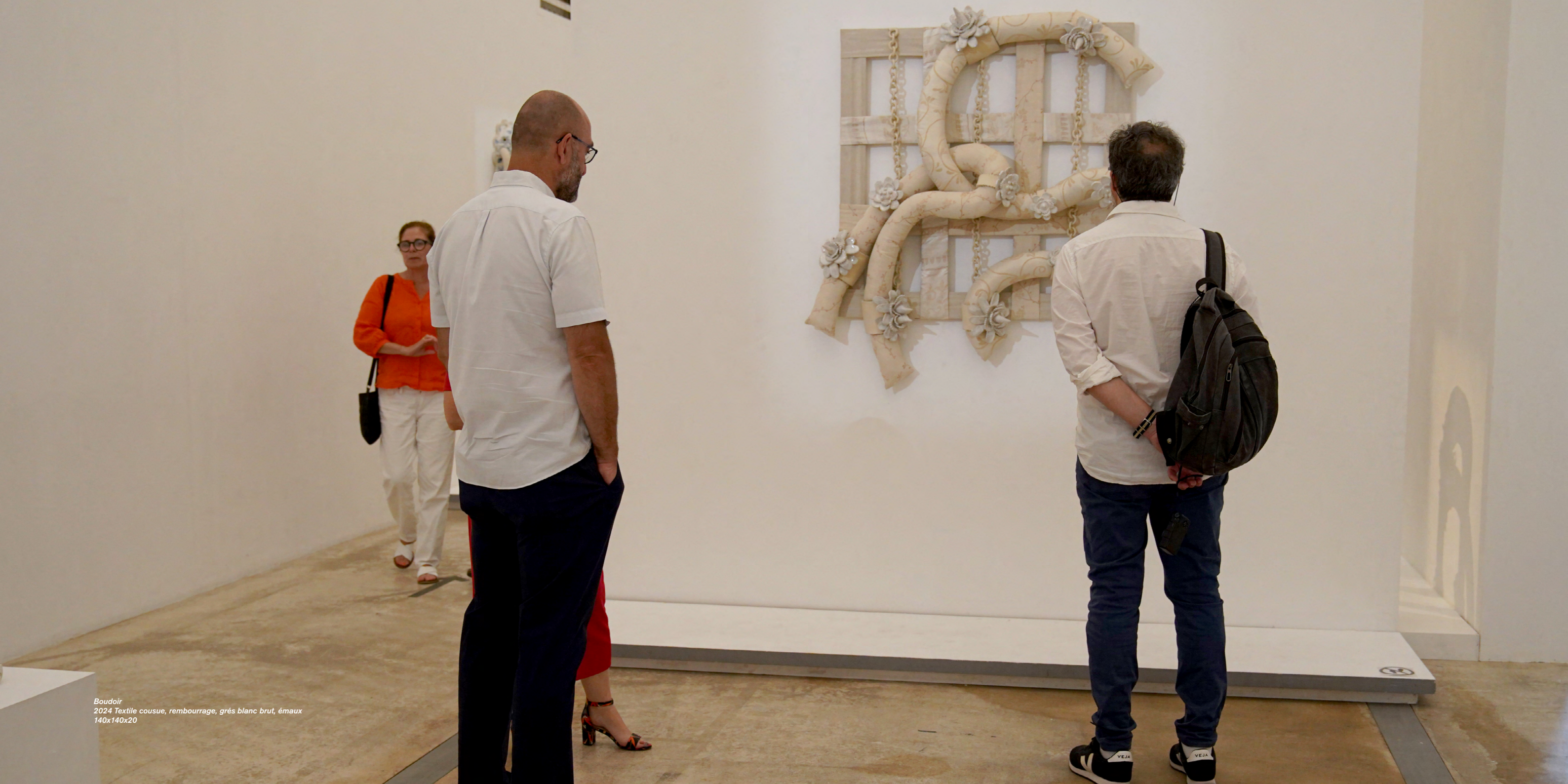
Boudoir 2024 Textile cousue, rembourrage, grés blanc brut, émaux 140x140x20