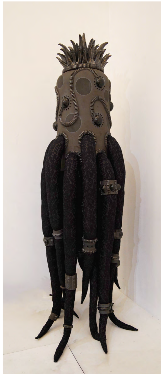
Belle 3 2018 grès noir, émaux tissus dentelles et rembourrage 60x70x210 cm