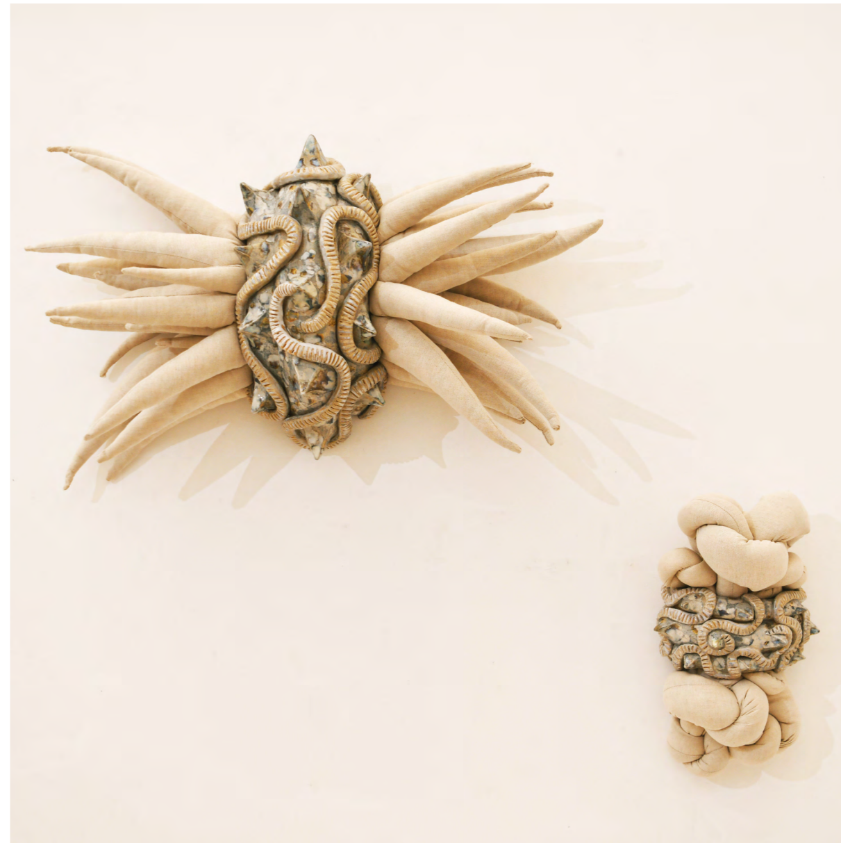
Mercredi 2 avril 2014 grès émaillé, toile métis cousue, rembourrage 90x80x28 cm