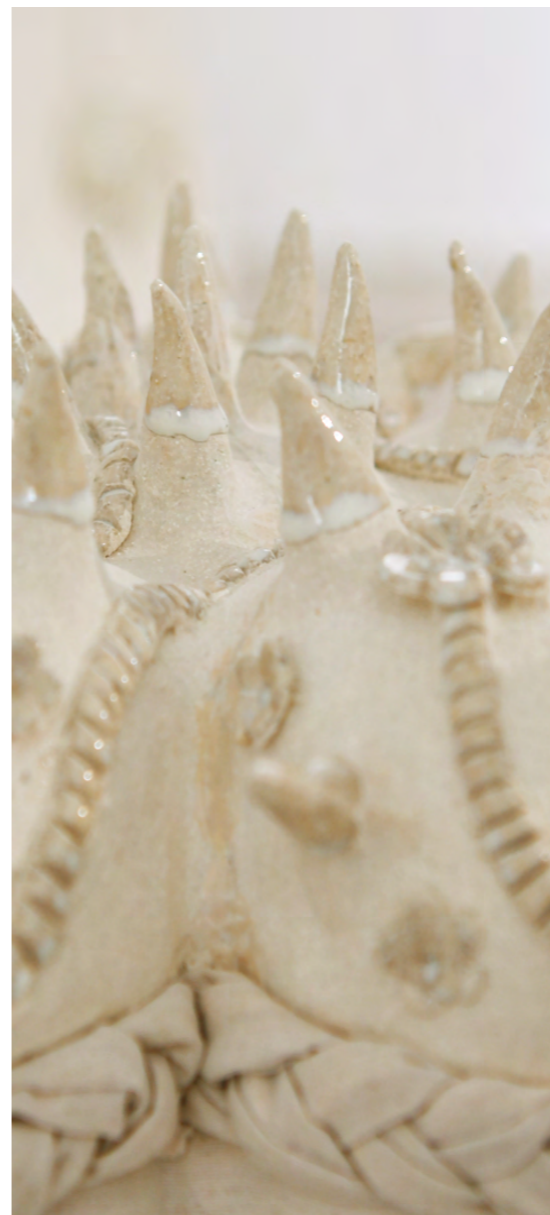
Détails de jeudi 7 avril 2016 grés, porcelaine, Émaux, textile cousue, rembourrage