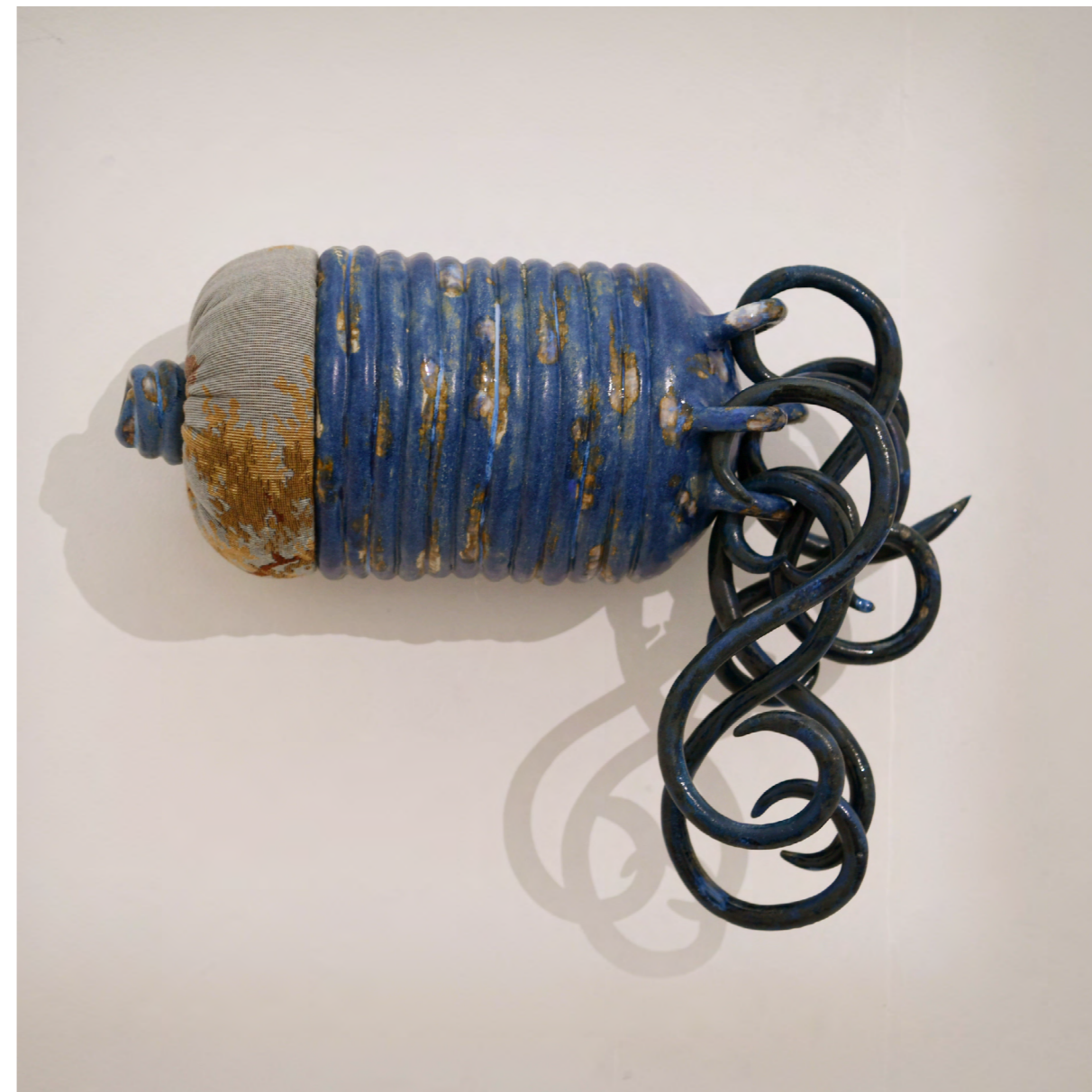
Paysage bouclé 2 2021 grés émailé, tapisserie cousue, rembourrage 5x43x17