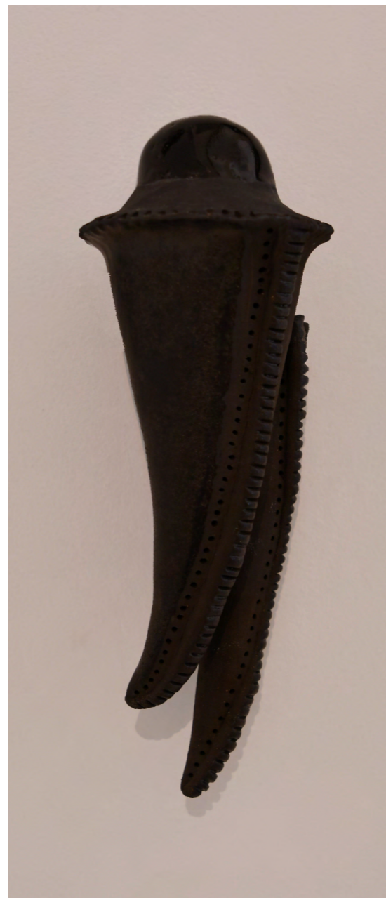
Glissade 3 2022 grès noir, émaux, engobe 9x26x8 cm