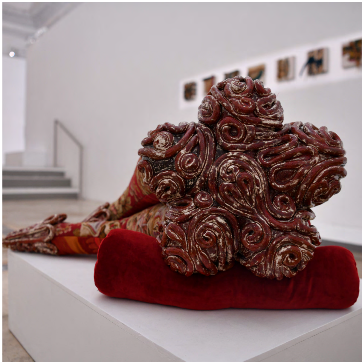
Rouge brûlée allanguie 2021 grès émaillé, tapisserie cousue, rembourrage, tissu et velours 94x58x45 cm