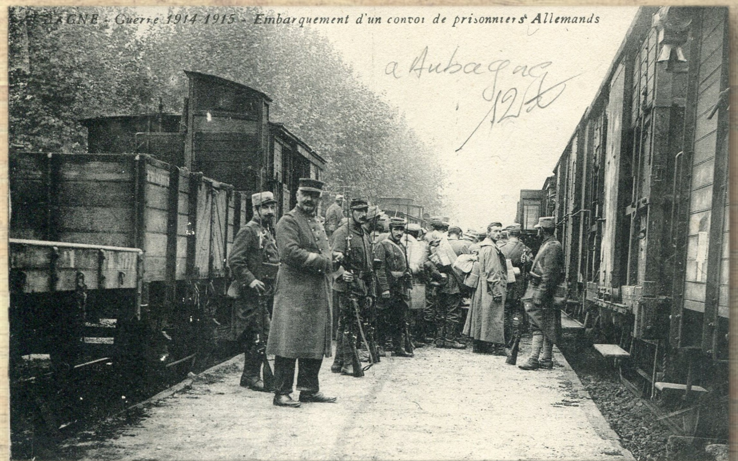
AUBAGNE - Guerre 1914-1915 - Embarquement d'un convoi de prisonniers Allemands