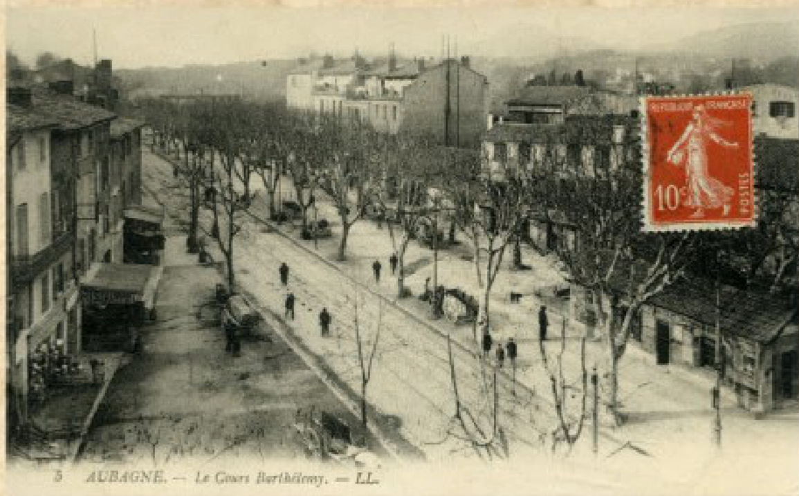
Place Domergue et cours Barthélemy vers 1910