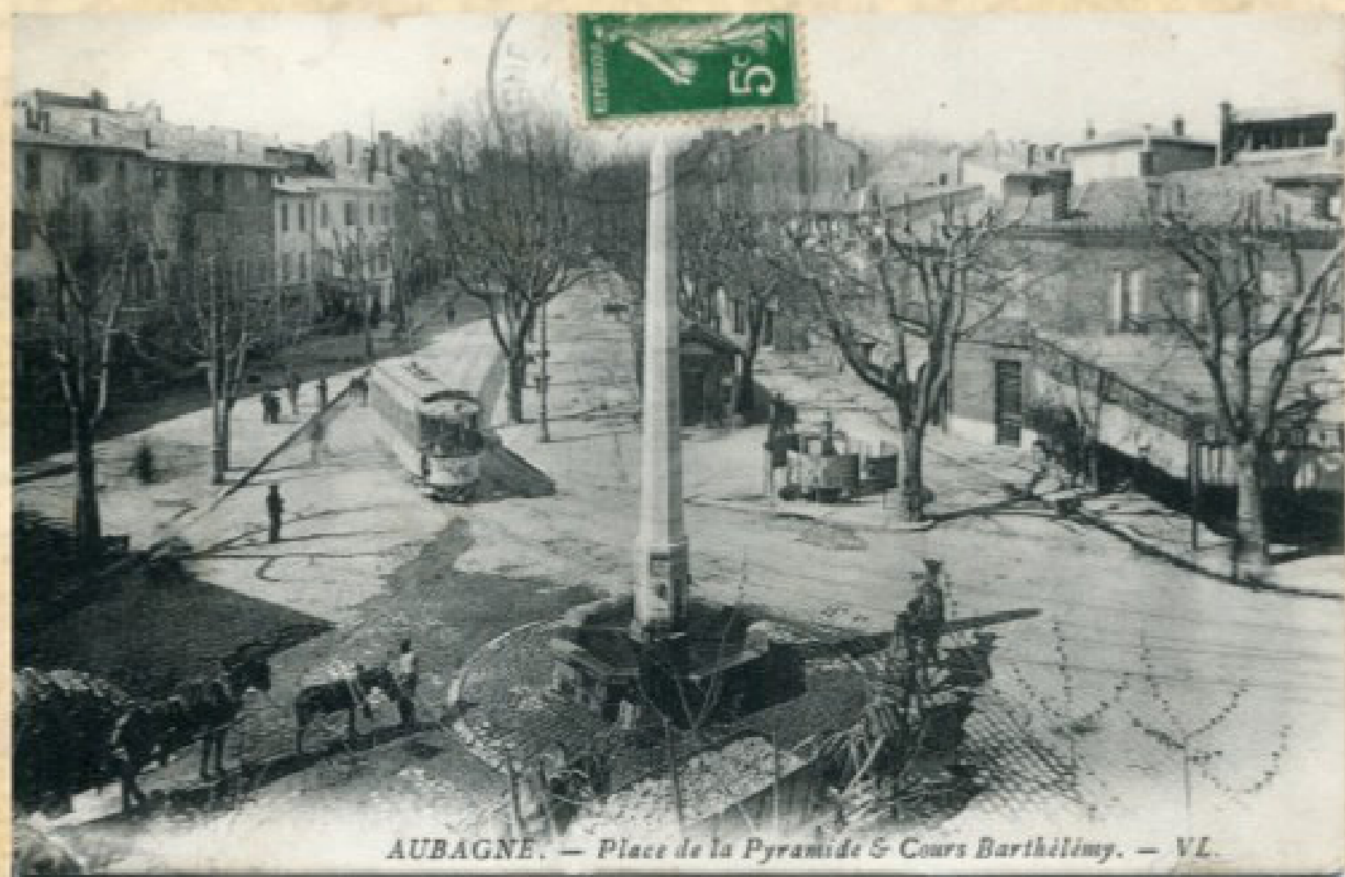
AUBAGNE. — Place de la Pyramide & Cours Barthélemy. — VL.

De forme octogonale, elle fut ornée d'un obélisque de 10m de haut, en pierre de Beaucaire. Les eaux de la source des Lignières qui alimentèrent en premier la fontaine s'écoulaient par quatre canons dans le bassin en pierre de Cassis.