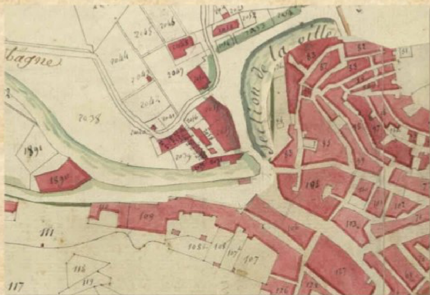
Extrait des feuilles F et I du plan du cadastre napoléonien (1811) où l'on voit l'ancien lit de l'Huveaune

A la fin du XVe siècle, un pont fut construit sur l'Huveaune pour faire le lien entre le faubourg du Mouton (rue des Cauquières) et la rue Rastègue. Il fut nommé le Pont Neuf.