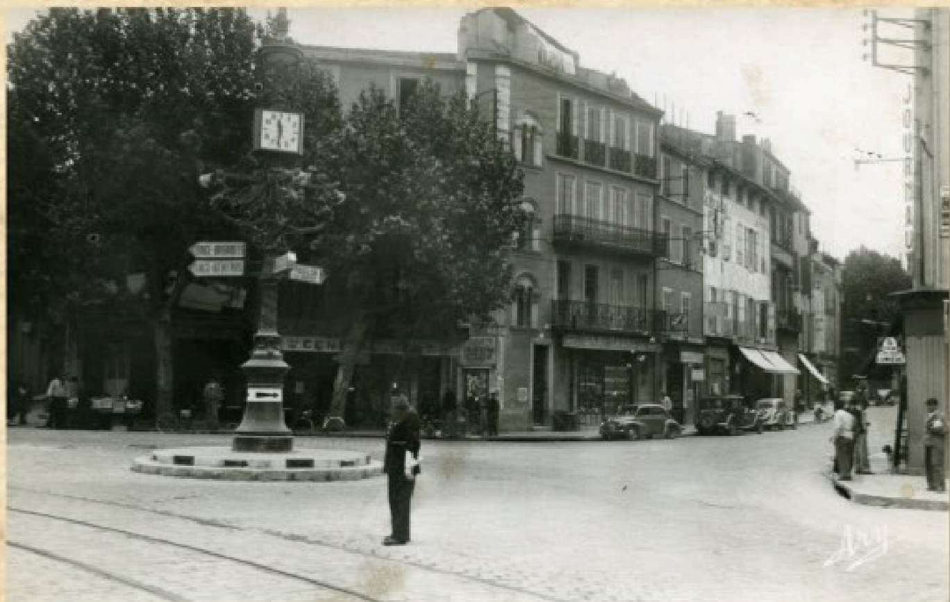
Le carrefour de la place Pasteur 21 Fi 86