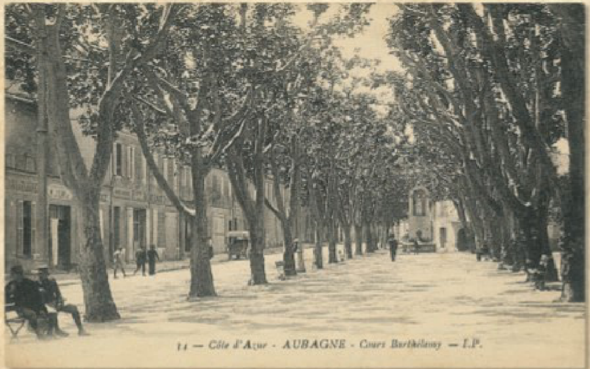
Le cours Barthélemy et le monument à l'abbé Barthélemy au fond — Archives Municipales 20 Fi 91

Le cours Barthélemy, lui, fut aménagé en 1855 pour créer une promenade le long de la Route Nationale n°8 de Marseille à Toulon. Il reçut en 1893 la fontaine et le monument consacrés à l'abbé Barthélemy, arrière-grand-oncle de Xavier Sauvaire de Barthélemy.