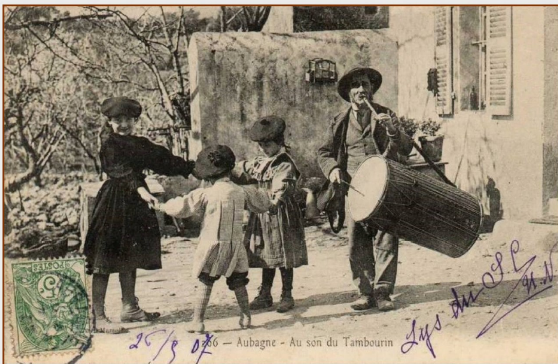
Au son du tambourin du Père Né

En cette période calendale, propice à renouer avec nos traditions, il était important de mettre à l'honneur ces musiciens si présents au XIXe siècle et toujours incontournables de nos fêtes et crèches provençales.