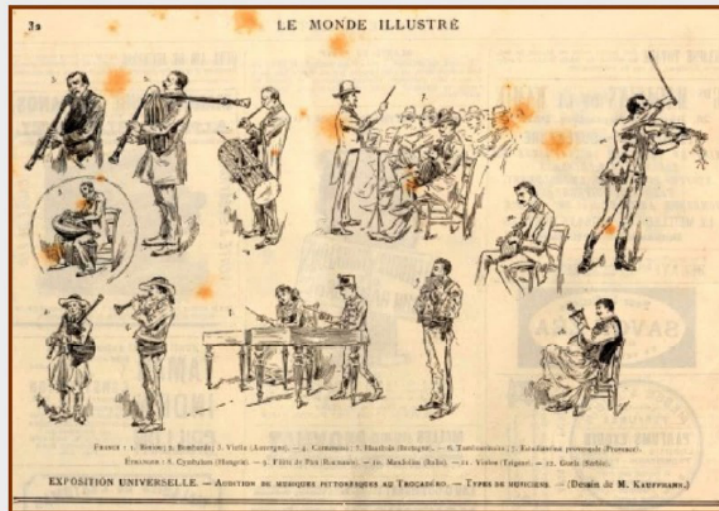
Auditions du concours de musiques pittoresques de France et de l'étranger de l'Exposition Universelle de 1889. Le Monde Illustré, 13 juillet 1889, dessin de M. Kauffmann