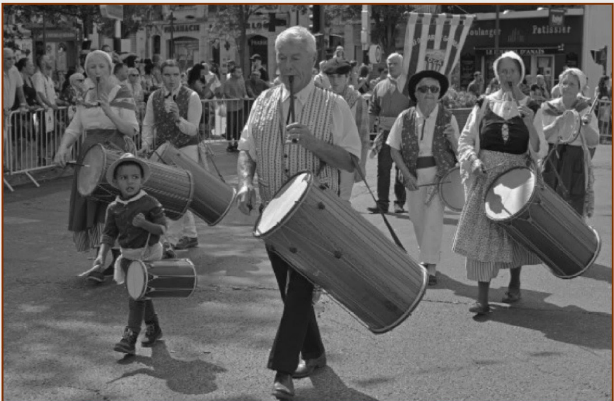
Les tambourinaires des Dansaires de Garlaban lors de la Cavalcade, dimanche 20 août 2017