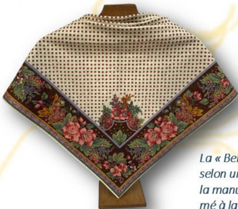
La « Belle Saison », reproduction selon un modèle de 1780-1790 de la manufacture Haussmann, imprimé à la planche, Mulhouse.