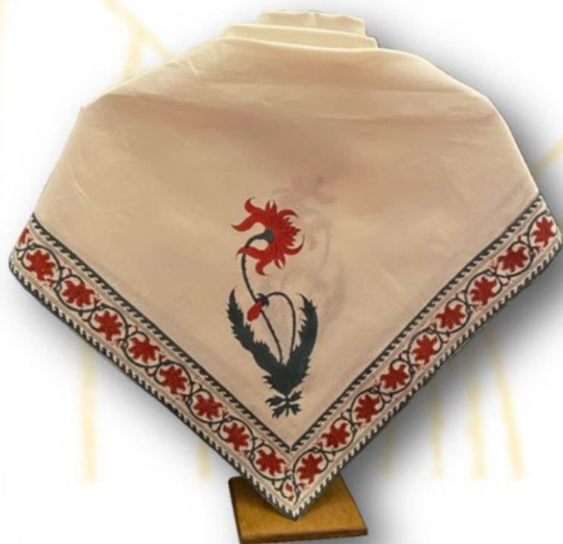
Fichu au Dalhia en écoinçon, imprimé à la planche. Atelier Thierry GUIEN