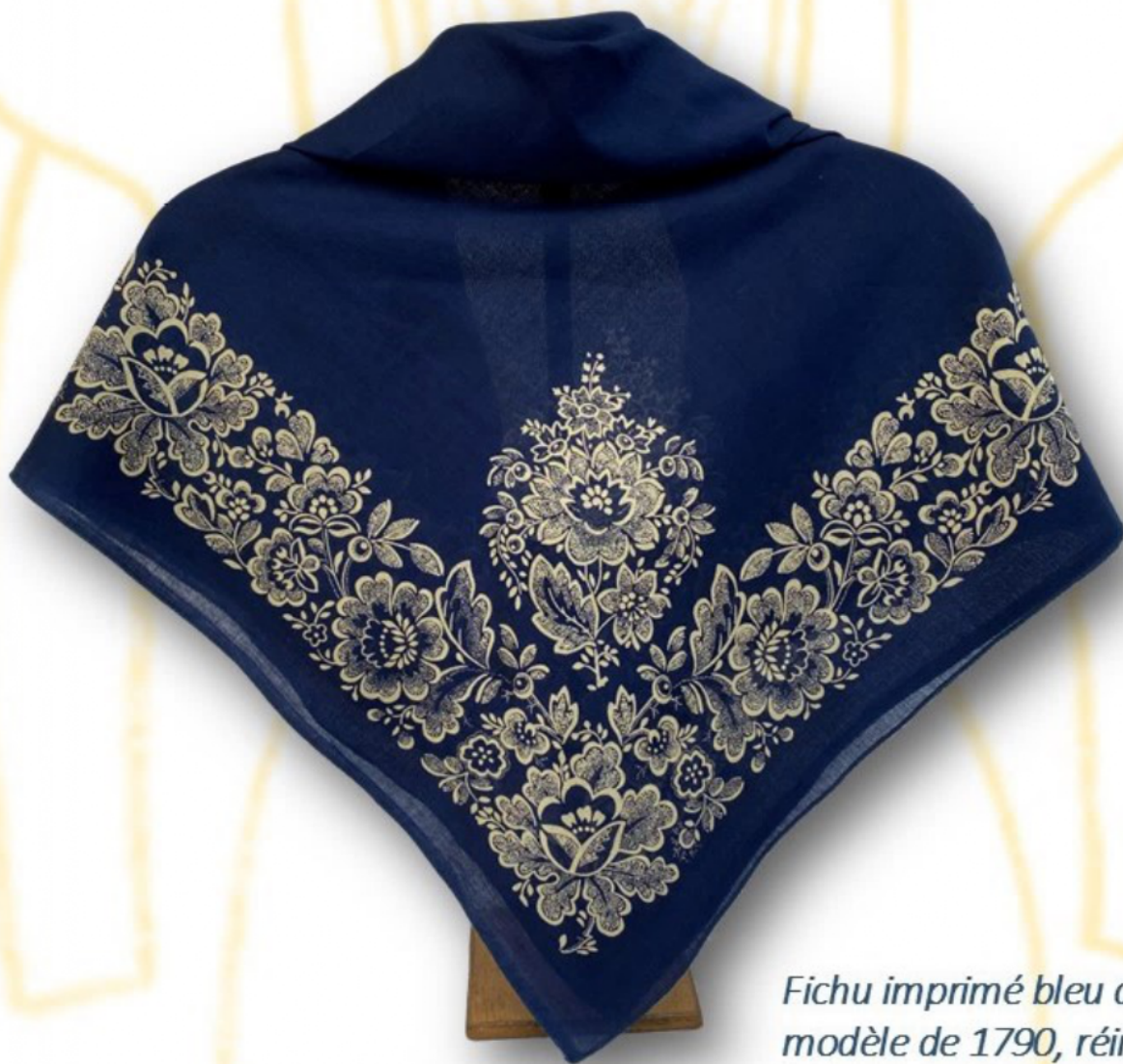
Fichu imprimé bleu d'après un modèle de 1790, réimpression dite « à l'enlèvement », par Thierry GUIEN

Impression à la réserve : technique ancienne qui permet de composer des motifs sur un textile en empêchant le colorant de se diffuser sur des zones prédéfinies en appliquant une substance « isolante » avant teinture (pâte, cire...). Encore très utilisé dans les motifs dits « batiks ».