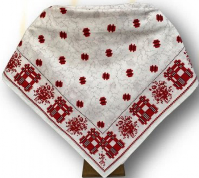
Fichu d'après un modèle de 1850, réimpression au cadre par Thierry GUIEN

Voici un élément incontournable du costume traditionnel de Provence aux XVIIIe et XIXe siècles. En effet, les femmes après avoir revêtu la camiso (chemise), lou coutihoun (jupon de dessous), lou courset (corset), lou coutihoun pica (jupon piqué) ou la raubo (robe), lou caraco (corsage), lou faudau (tablier) terminent par la couifo (coiffe) et lou fichu . Ne croyez pas que cette dernière pièce d'étoffe est négligemment posée sur les épaules, elle est soigneusement repliée en deux pour composer un triangle. Dans sa partie la plus large, trois plis sont formés et, pour être parfaitement tendu sur les épaules de ces dames, le fichu est tenu selon les préceptes des groupes folkloriques des années 1950, par quatre épingles : une fixée dans le dos, deux au niveau des épaules et la dernière pour le maintenir croisé sur la poitrine, les pointes glissées de chaque côté dans la ceinture du tablier. Tout le sens d'une expression apparaît alors : es tirado ai quatre èpinglo . Elle est tirée à quatre épingles. Il existe une grande variété de fichus. Ils peuvent être en laine, en soie, en mousseline ornée de broderies ou plus simplement en coton imprimé nommé « Indiennes ». Le décor de ces étoffes (fleurs, arabesques, damiers, oiseaux, palmettes...) est souvent concentré à l'intérieur d'un carré séparé du bord par une large bande imprimée dans un coloris contrastant avec le motif central.