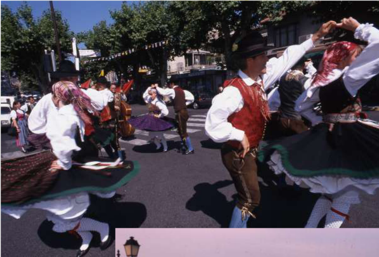
Le groupe autrichien « Edelweiss » sur la place Pasteur lors du festival Aquarelle en 1998