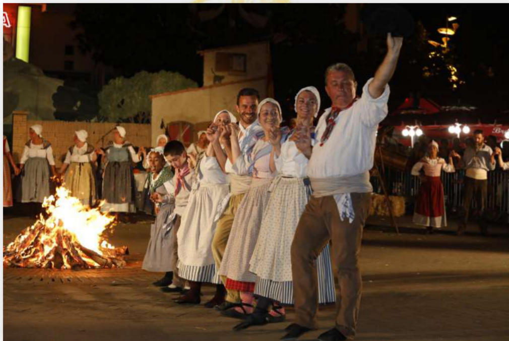
La Flamme de Garlaban, survivance de la fête païenne du solstice d'été, était allumée au sommet puis relayée jusqu'au cours Foch pour allumer le feu le soir de la Saint Jean.

Dans les années 1980, le groupe anime de grands moments de convivialité, fédérateurs, ainsi un gâteau des rois organisé en janvier permet au roi et à la reine de devenir les souverains du Bal masqué qui suit en mars... Des Castagnades, baleti, loto, grand aioli traditionnel du 11/11 ponctuent la vie des Dansaire... Ils participent à l'animation de la cité en accompagnant les festivités provençales : les feux de la Saint-Jean, les Foires aux Santons et à la Céramique.