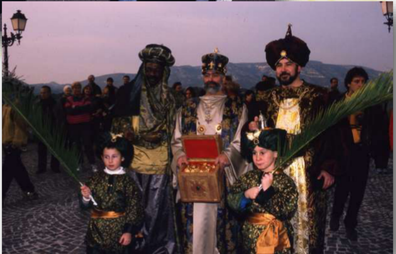
Première Marche des Rois à Aubagne, 08/01/2000