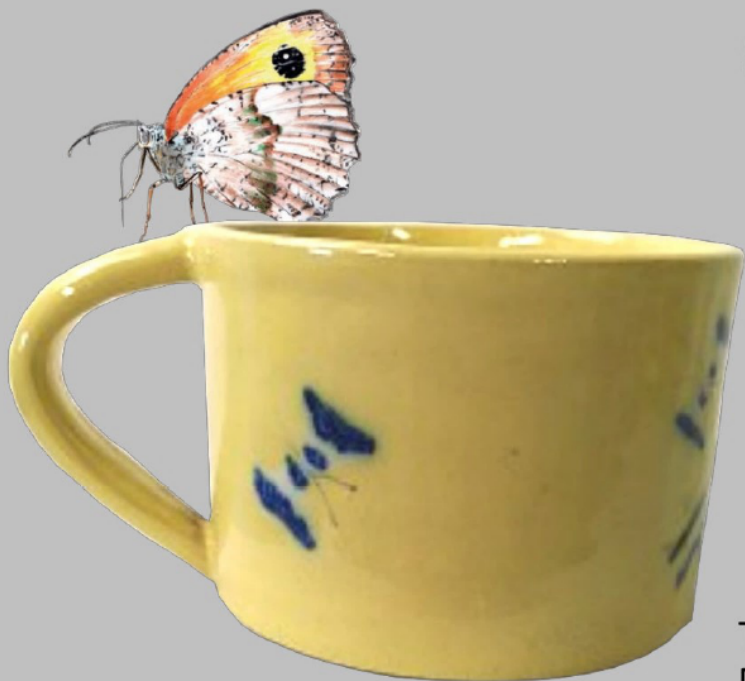
Tasse Gastine, Métropole AMP