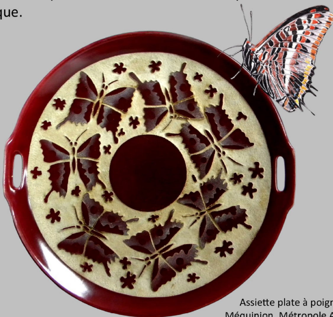
Assiette plate à poignées Méquinion, Métropole AMP

Cet ancien élève des Beaux-Arts de Paris, devenu premier sculpteur chez le maître du verre contemporain, René Lalique, quitte son atelier de Courbevoie pour le sud de la France au moment de la débâcle de 1940. De sa rencontre avec Jacques Bourdillon, patron de Procéram, naît l'idée de transposer sur faïence, la technique qu'il utilise jusque-là sur cristal. Cette invention qui combine « jet de sable » et selon les cas, l'usage des acides et le « fraisage », fait l'objet d'une demande de brevet datée du 14 mars 1941, délivré le 30 novembre 1942. Chez Procéram, Méquinion, aidé de quelques proches, interprète sur la faïence tout le répertoire hérité de l'Art déco qu'il a mis en œuvre chez Lalique.