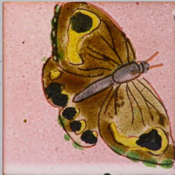
Carreau décoratif, atelier Idlas, années 1960, Métropole AMP