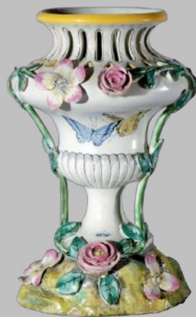
Pot pourri, atelier Aubert, fin XIXe, Métropole AMP

La plus célèbre d'Aubagne à la fin du XIXe siècle est à l'origine un modeste atelier de potier devenu faïencerie en 1879 puis véritable manufacture grâce au génie de Siméon Aubert, céramiste né à Roquevaire en 1834. Il s'adjoint les talents du peintre Léonard Mazière, formé d'abord à Limoges puis à Varages. La production de cet atelier prestigieux est en grande partie semblable à celle de Moustiers et de Varages, lorsque le peintre y œuvrait. Les formes sont les mêmes puisque les pièces sont souvent estampées sur les moules du XVIIIe siècle. Les décors floraux et papillons trahissent la délicatesse du peintre porcelainier. En 1906, la fabrique compte 11 ouvriers et produit 300 000 carreaux et pièces de faïence. Elle ferme en 1910 au décès de Siméon Aubert.