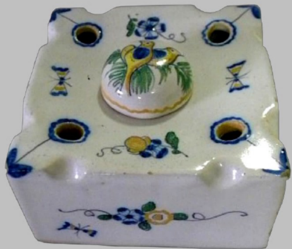
Encrier Gastine, années 1930