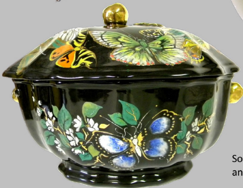
Soupière F.N.P. section d'art, années 1930, Métropole AMP