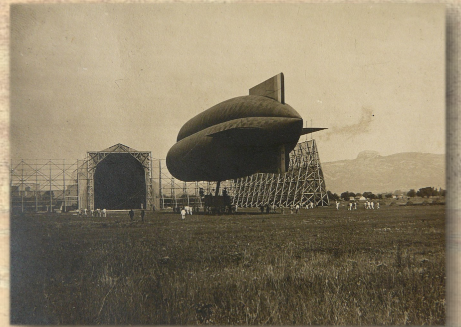
Le deuxième hangar, construit en 1918

“ Commandé par l'enseigne de vaisseau David, le ballon s'éleva lentement dans l'air calme aux applaudissements de centaines de curieux venus à Coulines depuis Cuges et Aubagne. (...) Dès lors, les sorties se succédèrent. Elles attiraient de plus en plus de curieux. (...) Aux enfants que nous étions, les aérostatiers donnaient des morceaux d'étoffe caoutchoutée, tirés de vieilles enveloppes de dirigeables. Nous en faisons des lance-pierres. Les hommes en confectionnaient des blagues à tabac. ”