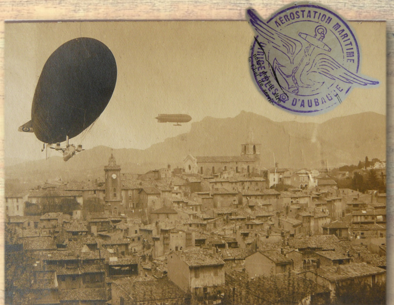
Les dirigeables survolant Aubagne