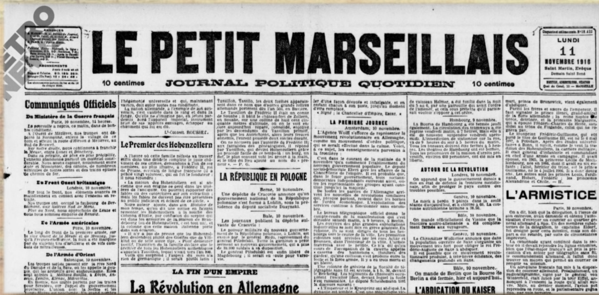
Dans Le Petit Marseillais du 11 novembre 1918, l'Armistice ne fait pas encore la Une. Et pour cause : il sera signé quelques heures après la parution du journal

Après celui signé à Thessalonique le 29 septembre entre les Alliés et la Bulgarie, celui signé le 30 octobre à Moudros entre les Alliés et l'Empire ottoman puis celui signé le 3 novembre à Padoue entre l'Italie et l'Autriche-Hongrie vient L'ARMISTICE : le 11/11/1918 à 11 h.