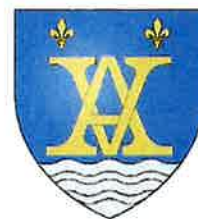
Municipalité de Aubagne