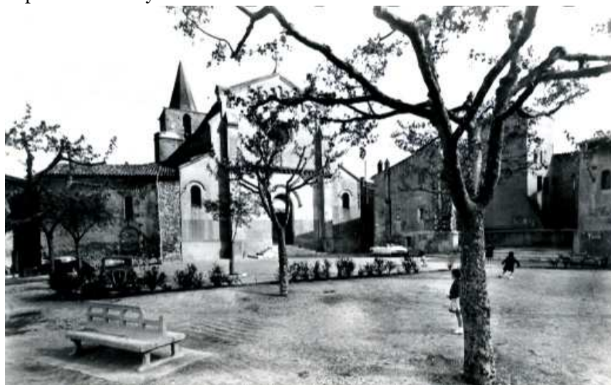
La place de l'Eglise au milieu du XX e siècle. Au premier plan, l'emplacement du château. (cp Société Editions de France, 2 rue Clapier Marseille).

Au début du XX e siècle, le prétoire servait au logement du fontainier de la ville et les prisons à celui du garde champêtre ainsi qu'à l'hospitalisation des pauvres passants. La municipalité, dans un souci d'embellissement, acheta l'emplacement du château en 1902 et fit démolir l'année suivante les prisons et l'ancien prétoire de justice. L'ensemble de l'espace fut arasé et déblayé en 1905 afin de doter les vieux quartiers d'une grande place publique. Les terres enlevées du monticule servirent à remblayer le pré où fut construit le dépôt de tramway.