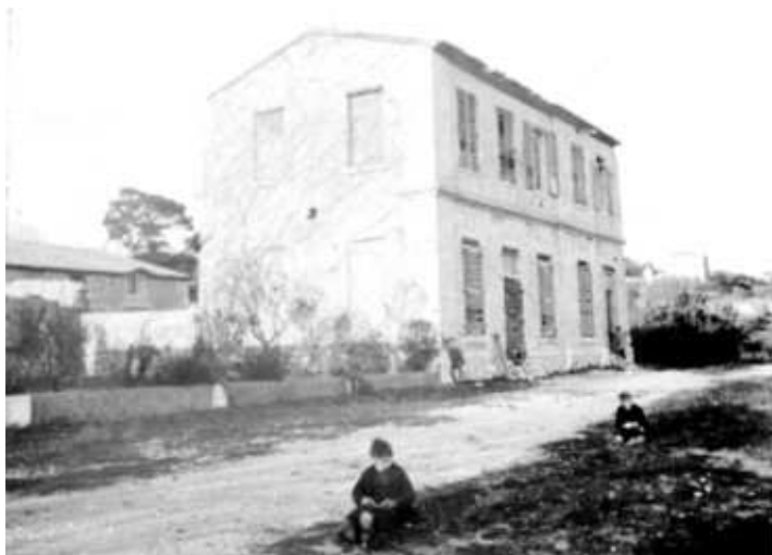
La maison de campagne dite l'Evêché..

Bonsignour vendit cette propriété en 1830, les propriétaires suivants morcelèrent les terrains pour l'établissement de la ligne de chemin de fer. Au début du XX e siècle, s'élevèrent de petites maisons où les familles aubagnaises passaient le dimanche. La maison de campagne de Blancard subsista jusqu'en 1972, date de sa démolition pour permettre la construction du Foyer Popineau. Plus rien ne subsiste aujourd'hui de cette grande propriété.