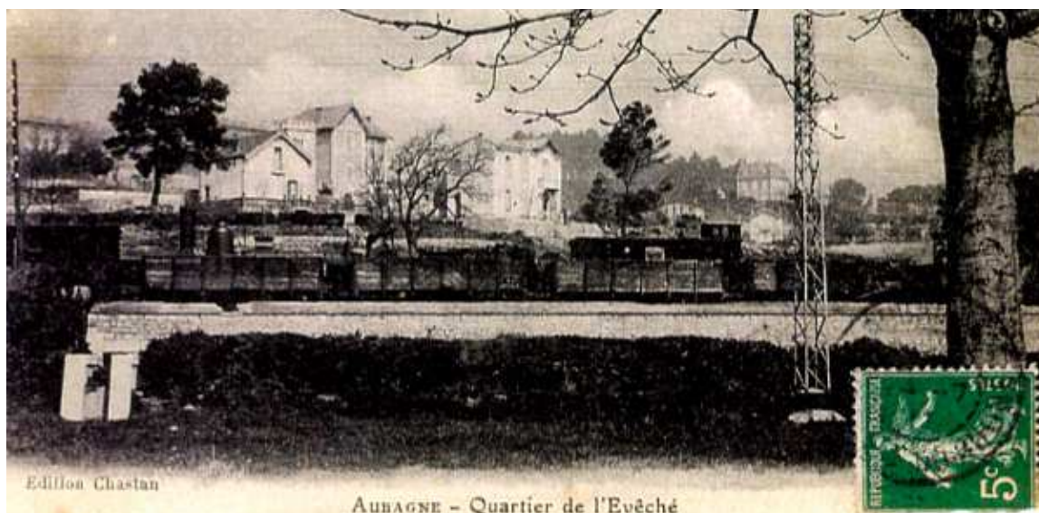
Le quartier de l'Evêché au début du XX e siècle.