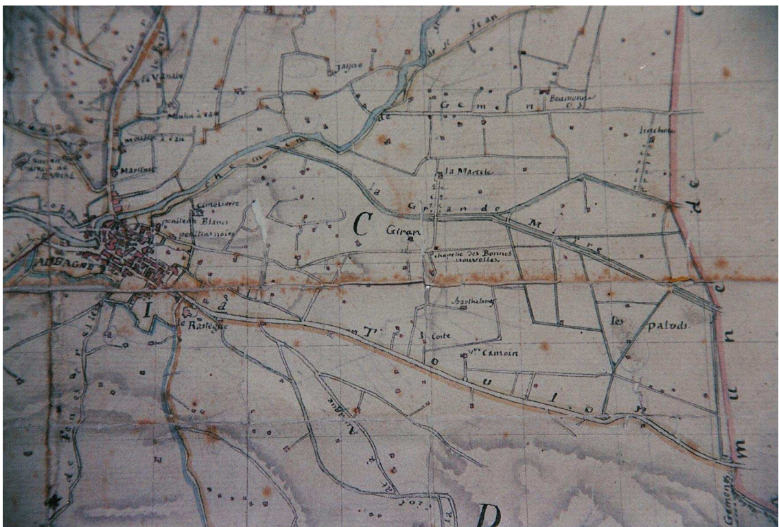
Le quartier des Paluds et ses canaux d'assèchement, cadastre Napoléonien.