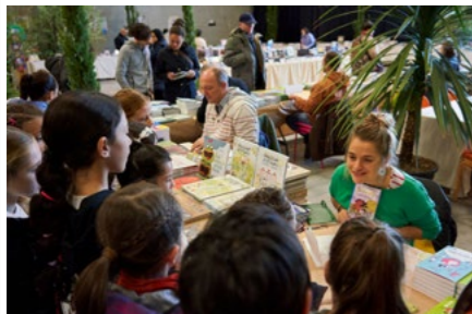
Le festival Grains de sel doit beaucoup à l'organisation sans faille de l'équipe de la Médiathèque