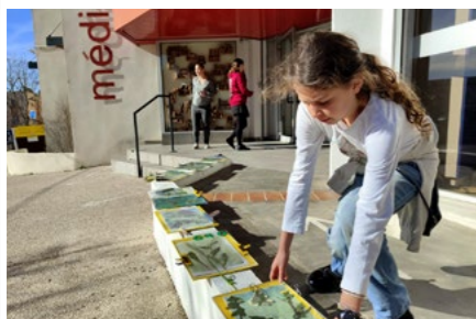
Un atelier de cyanotype (procédé ancien de photographie artistique) ouvert aux adolescents