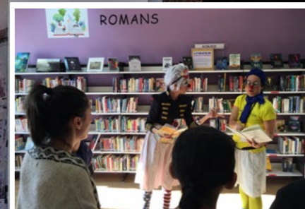
Le festival métropolitain Lecture par nature fait étape chaque année à la médiathèque Marcel Pagnol