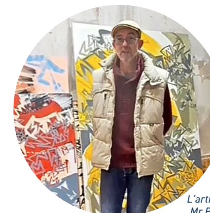
L'artiste Mr Post

Le centre d'art contemporain Les Pénitents Noirs accueille du samedi 13 avril au samedi 4 mai 2024 l'exposition « Entre deux » de l'artiste Mr Post.