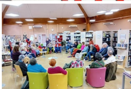
Le club de lecture de la médiathèque : un incontournable !