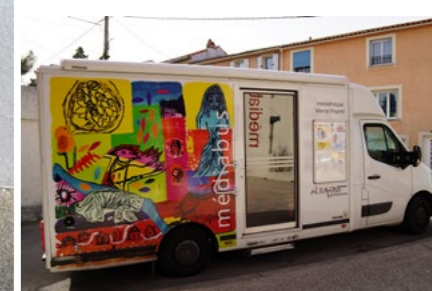
Le Médiabus assure 13 dessertes régulières, dans les crèches, les maisons de retraite, les ESAT et dans tous les quartiers.

Premier équipement culturel d'Aubagne avec plus de 50 000 entrées par an, la médiathèque Marcel Pagnol fêtera ses 50 ans l'année prochaine. Porte d'entrée privilégiée (et gratuite) pour la culture et le loisir, inscrite dans la plupart des événements de la Ville, elle a su tisser un lien d'attachement fort avec tous ses publics.