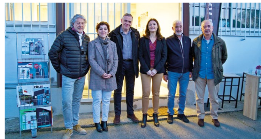
L'association de la zone d'entreprises Pôle Alpha a inauguré ses nouveaux locaux le 21 mars dernier.