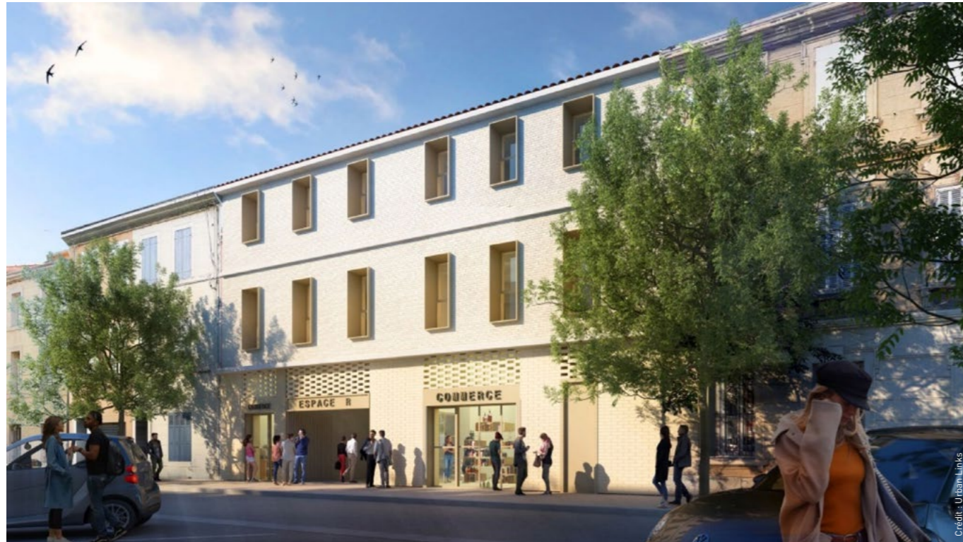
➔ Après 14 à 16 mois de travaux, la livraison de l'Espace R devrait intervenir fin 2025, voire début 2026.

Lorsque la SOLEAM* en partenariat avec la Ville d'Aubagne a acquis l'ancienne fabrique de dragées située avenue Jeanne d'Arc et a lancé son appel à projets pour sa réhabilitation, plusieurs entreprises, portant autant de projets, se sont manifestées. En fin d'année dernière, à l'issue d'une consultation menée par les collectivités, la société Urban Links a été choisie pour la revitalisation de ce site industriel historique. L'Espace R est un projet traversant avec une entrée principale sur l'avenue Jeanne d'Arc. Au rez-de-chaussée sont prévus un local à vocation commerciale et un espace de coworking sur 400 m 2 , ouverts côté gare routière. Le premier étage accueillera des bureaux et le deuxième, une crèche et un rooftop avec une terrasse