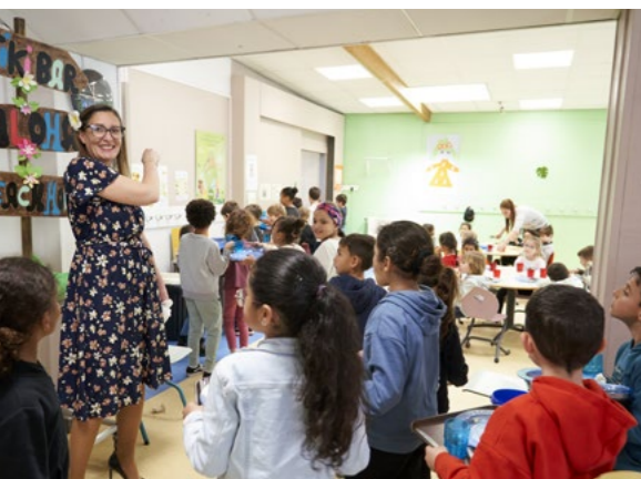
➤ Animation pédagogique de Garig le 22 mars à l'école Antide de Boyer sur le thème de Tahiti

Prestatrice de la restauration collective à Aubagne depuis le 1 er septembre dernier, Garig propose également des animations dans les écoles de la Ville lors des pauses méridiennes. Ces ateliers autour de la nourriture et de l'alimentation plus