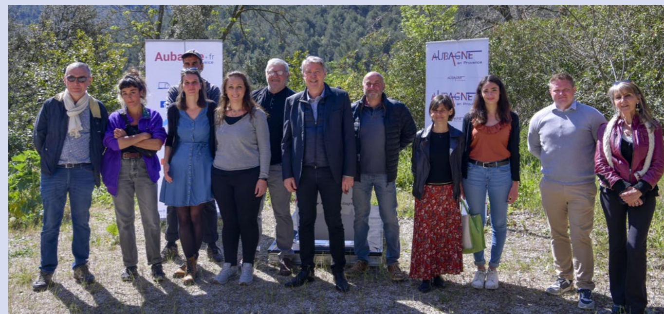
➤ Printemps 2023 : signature de baux avec six agriculteurs sur le site de Camp de Lambert, destiné à l'agriculture locale et bio.

Enfin il est à souligner que le futur Pôle Éducatif des Passons, destiné à devenir un pôle d'excellence conjuguant pédagogie, lieu d'animations et cadre environnemental préservé, est entré dans sa première phase de construction. Sa conception bioclimatique valorise les espaces extérieurs, son équipement novateur favorise la sobriété énergétique : la brique de son enveloppe extérieure, de terre cuite ou de terre crue, fabriquée sur place, évoque l'artisanat local et le travail de l'argile dans le pays aubagnais.