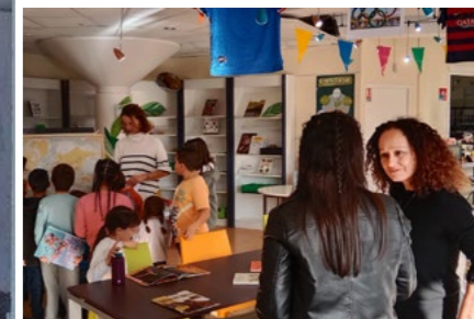
Depuis un an, l'espace Ludothèque accueille les amoureux du jeu de société