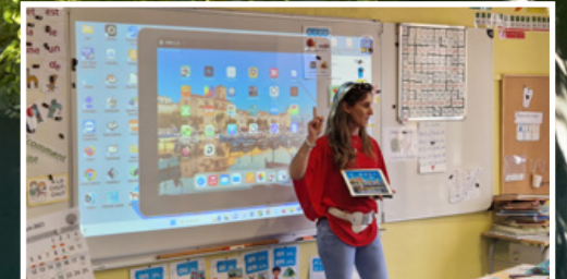
Dans le cadre du plan numérique, 60 vidéoprojecteurs interactifs ont été installés