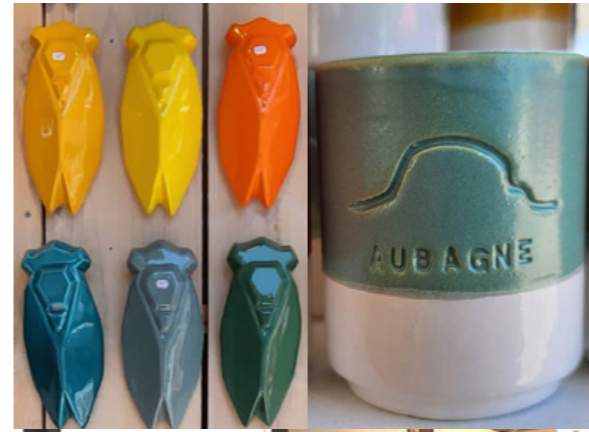
OTI Bormes-les-Mimosas et La Provence