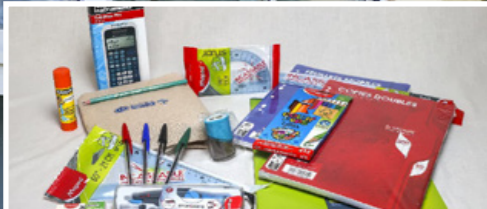
Les élèves des collèges et lycées aubagnais vont pouvoir bénéficier d'un kit de fournitures scolaires grâce au Conseil départemental des Bouches-du-Rhône dans le cadre du plan Charlemagne 2017-2027.