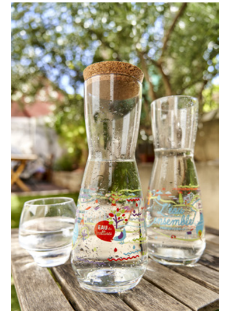
Cette carafe "collector" est en vente au prix de 10€ TTC à l'Eau des collines, au 140 avenue du Millet 13400 Aubagne.

La Société publique locale L'Eau des collines gestionnaire de l'eau et de l'assainissement du Pays d'Aubagne et de l'Étoile, présente sa nouvelle carafe d'eau en verre en édition limitée ! Forte de son succès depuis son instauration en 2015, cette 6 e édition met en scène les deux ressources principales du territoire : l'eau de la Durance ainsi que les forages des nappes phréatiques, essentiels pour sécuriser les approvisionnements. Son slogan « l'Eau est rare, Ensemble préservons la ! » nous rappelle l'urgence de protéger cette précieuse richesse.