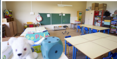
À l'école Gaimard, 6 classes ont été rénovées. 3 d'entre elles accueilleront des classes transférées dans le cadre du projet de Pôle éducatif des Passons.