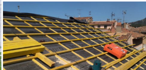
Réfection du toit terrasse du Centre d'information et d'orientation (CIO) de l'école Chaulan.