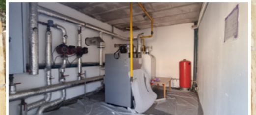
La gestion de la totalité des chaufferies des écoles aubagnaises est en voie d'être centralisée et sera pilotée à distance par un prestataire choisi pour 5 ans.

La végétalisation des cours d'écoles, très attendue, a démarré et concernera l'ensemble des établissements.