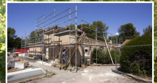
Le chantier de la crèche de La Garenne a débuté, avec un investissement de 850 000 €

en gestion technique, centralisée et pilotée à distance par un prestataire choisi pour 5 ans. Le début du chantier du Pôle éducatif des Passons a nécessité le déménagement des classes de maternelle et des travaux dans les écoles accueillantes (voir article en page 13). Enfin, des travaux importants ont débuté à la crèche de la Garenne pour un montant total de 850 000€ : ils devraient être terminés en octobre pour la crèche qui occupe le rez-de-chaussée, à la fin de l'année pour le deuxième étage et la Protection maternelle et infantile (PMI). Une section pour les enfants à besoins différents est créée ainsi qu'un espace Snoezelen, dédié à la stimulation multisensorielle des enfants dans une ambiance sécurisante. Bonne rentrée à toutes et à tous !